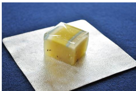
ジョン・マクロフリンのキウイの羊羹