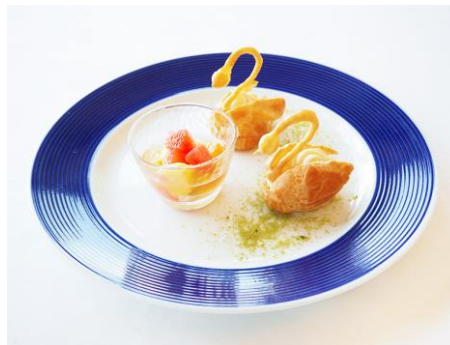
白鳥のレモンカスタードシュー 季節の果物のマCHEDONIA