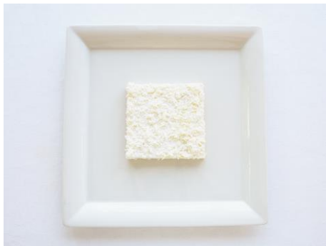
ロバート・ライマンのホワイトチョコと オレンジソースのひんやりタルト