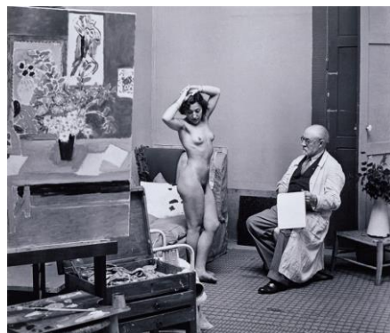
ブラッサイ《マティスとモデル、1939年》1973年

出品作家：アンリ・マティス、ピエール・ボナール、ピエール・オーギュスト・ルノワール、ブラッサイ、パブロ・ピカソ、マックス・エルンスト、リチャード・ハミルトン、ロイ・リキテンスタイン、ジョゼフ・コーネル ほか