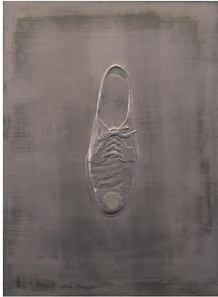
ジャスパー・ジョーンズ《ハイスクールの日々》1969年 © Jasper Johns / VAGA, New York & JASPAR, Tokyo, 2017 C1343