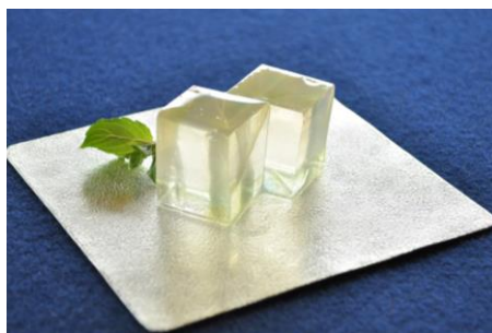
ラリー・ベルの梅シロップの錦玉