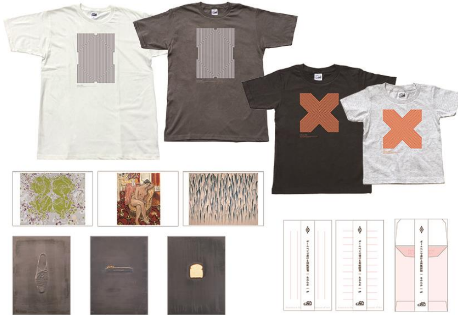
ステラTシャツ（復刻）、ポストカード、和紙便箋・封筒

ミュージアムショップでは本展に合わせ、Tシャツ、特殊加工を施したポストカード、和紙の便箋と封筒など、オリジナルグッズを新たに展開します。