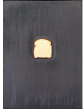
ジャスパー・ジョーンズ《パン》 1969年 © Jasper Johns / VAGA, New York & JASPAR, Tokyo, 2017 C1343

出品作家：クレス・オルデンバーグ、ジャスパー・ジョーンズ、赤瀬川原平、クリスト、リチャード・ハミルトン