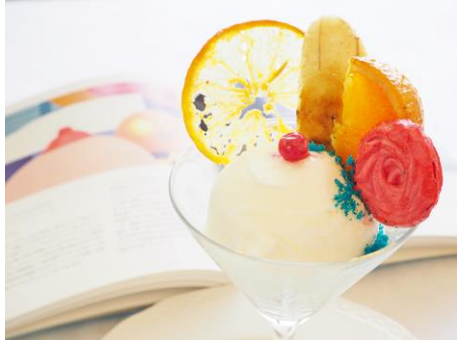
トム・ウェッセルマンのヨーグルトアイスサンデー

庭園のレストラン「ベルヴェデーレ」では、当館の作品や池に遊ぶ白鳥をモチーフにしたデザートを期間限定（7/4-8/31）でご用意します。