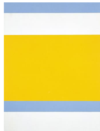
ジョン・マクロフリン《X-1958》1958年 DR