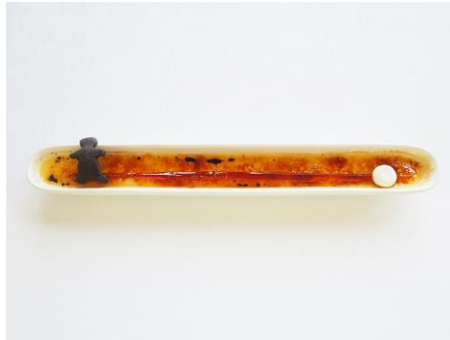
エンツォ・クッキのぱりぱりクレームブリュレ