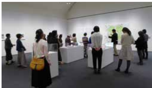
学芸員による特別ガイド