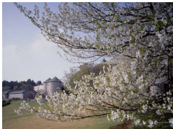
白鳥池前に咲くヤマザクラ