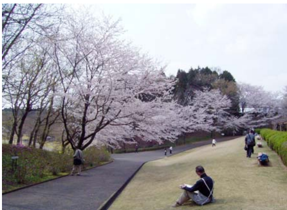
庭園内に120本あるソメイヨシノ 2009.4.7 撮影

アクセス：京成佐倉駅/JR佐倉駅より無料送迎バス 約30分/20分 東関東自動車道・佐倉ICから約10分(無料駐車場300台)