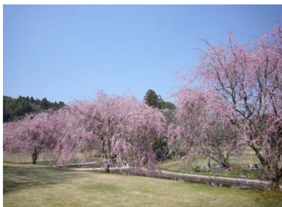
庭園奥の散策路沿いに並ぶシダレザクラ 2009.4.9 撮影