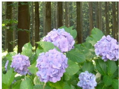
木陰で涼しい杉林の中のアジサイ