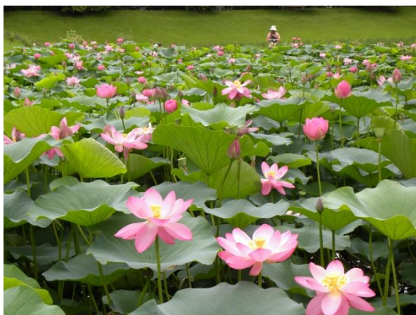
310㎡の蓮池一面に咲くオオガハス 昨年の様子