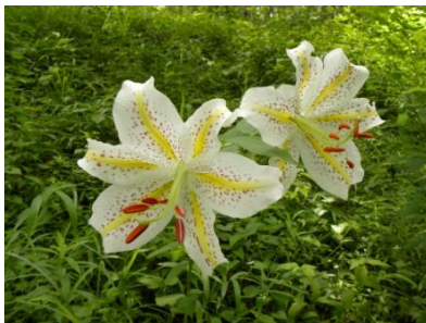
ヤマユリ 昨年の様子