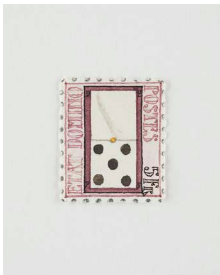
図版 2. ドナルド・エヴァンス 《Domino, 1934. Domino》1974年 個人蔵 ©The Estate of Donald Charles Evans

言葉が造形性を伴いながら拡散してゆく平出独自の概念「空中の本」を踏まえた会場構成は、建築家の青木淳が担当。全長約12mのアクリルと鉄で作られた「透明梁」を用い、詩人と美術家たちが、あるいは言葉と形象が重力から解放放たれて交差する空間を現出させます。