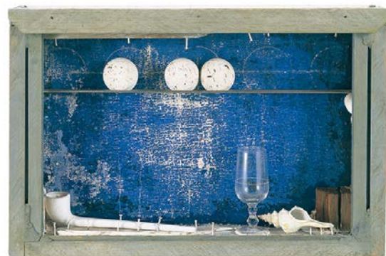
図版 3. ジョゼフ・コーネル《鳥たちの天空航法》1961年頃 DIC川村記念美術館