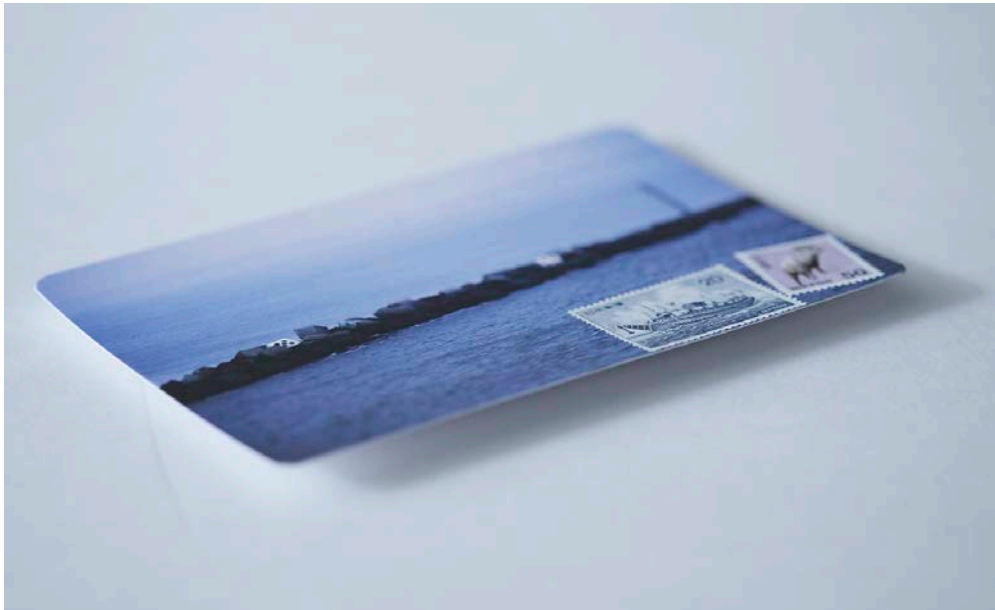
図版 1. 平出隆《private print postcard 011-z》1975年 個人蔵

国際的ベストセラー小説『猫の客』で知られる詩人、平出隆（1950-）。本展は、平出が「対話」を重ねてきた第一級の美術家たちとの長い歳月を軸に、美術作品に固有の思考や言語に光を当てるものです。独自の概念「空中の本」を踏まえた会場構成は建築家・青木淳が担当。全長約12mの「透明梁」を用い、詩人と美術家たちが、あるいは言葉と形象が重力から解き放たれて交差する空間を現出させます。