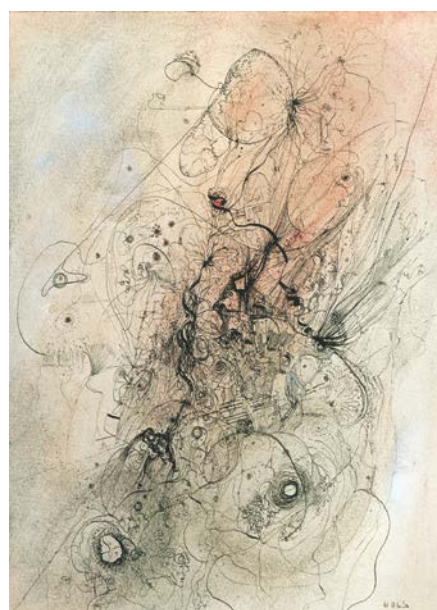
図版 2. 《コンポジション》1950年 グアッシュ、インク、紙 21.9 × 16cm DIC 川村記念美術館