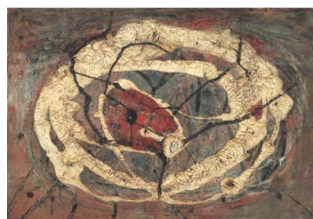
図版 10. 《閉路》1948 / 49年 油彩、カンヴァス 32.0 × 46.0 cm DIC 川村記念美術館