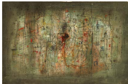
図版 8. 《作品、または絵画》1946年頃 グアッシュ、紙 20.5×31.5 cm 大原美術館

1940年に釈放されたヴォルスは、南フランスを転々としながら再び精力的に制作します。1942年にはニューヨークのベティーパーソンズギャラリーで水彩画の個展が開かれました。同年、ドイツ軍が南フランスを占領したため、夫妻はデュルフェイに逃れます。この地で夫妻は、マルセル・デュシャンとニューヨーク・ダダを推進したアンリ=ピエール・ロッシェと知り合います。ロッシェはヴォルスのよき理解者となって水彩画をコレクションし、ヴォルスについての文章も書いています。ロッシェらの協力で戦後は展覧会の機会も増えていきました。ヴォルスが本格的に油彩画に着手したのは戦後のことです。画商の勧めでカンヴァスを与えられ、独学で描いたその絵は、激しい筆致、絵の具の盛り上げ、ドリッピング、グラッタージュ（ひっかき）など、多彩な手法を使って動きのある画面となりました。