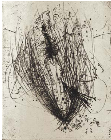
図版 12. 《裸体の花》1949 / 62年 サルトル『食糧』(1949年刊)の挿絵 ドライポイント、紙 12.3 × 10.0 cm DIC 川村記念美術館