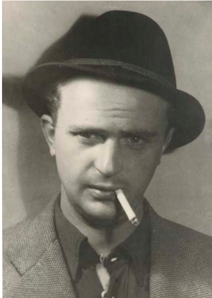
セルフ・ポートレイト 1938年 Kupferstich-Kabinett, Staatliche Kunstsammlungen Dresden

“WOLS”はペンネームで、本名はアルフレート=オットー=ヴォルフガング・シュルツ Alfred Otto Wolfgang Schulze (1913-51) です。父は著名な法学博士、ベルリンの豊かで教育ある家庭に生まれました。ドレスデンに医師の祖父がいて、姉や弟と幼少期を過ごしています。