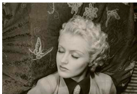
図版 3. 《無題》1939 / 79年 ゼラチンシルバープリント 30.7 x 22.9 cm 横浜美術館