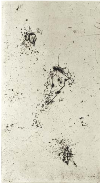
図版 11. 《三つの小さな漂う形》1949 / 62年 アルトー『セラフィム劇場』(1949年刊)の挿絵 ドライポイント、紙 18.5 × 10.5 cm DIC 川村記念美術館

戦後になって、パリでジャン＝ポール・サルトルと知り合ったのも大切な出会いでした。サルトルはヴォルスの作品を認め、彼に援助を与えます。ヴォルスはこの頃から手がけた銅版画で、不思議なイメージを描きだしました。銅版画は彼の生き生きした線描を活かすメディアで、ジャン・ポーラン、アントナン・アルトーら詩人、文学者の本の挿絵に使われています。サルトルもヴォルスに2冊の自著の挿絵を依頼しています。彼の書いたヴォルス論「指と指ならざるもの」は、サルトルの代表作を収めた『シチュアシオン』第4巻に収められています。