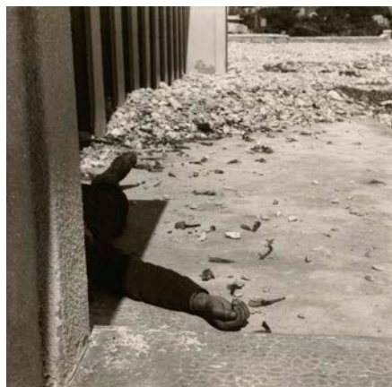
図版 6. 《ごみのある一隅、浮浪者》 1940-41 / 1976年 ゼラチンシルバープリント 16.3 x 17 cm The J. Paul Getty Museum, Los Angeles