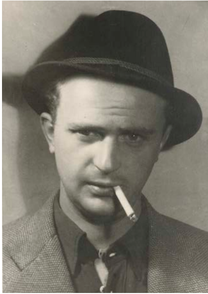
セルフ・ポートレート 1938年 Kupferstich-Kabinett, Staatliche Kunstsammlungen Dresden

“WOLS”はペンネームで、本名はアルフレート=オットー=ヴォルフガング・シュルツ Alfred Otto Wolfgang Schulze (1913-51) です。父は著名な法学博士、ベルリンの豊かで教育ある家庭に生まれました。ドレスデンに医師の祖父がいて、姉や弟と幼少期を過ごしています。