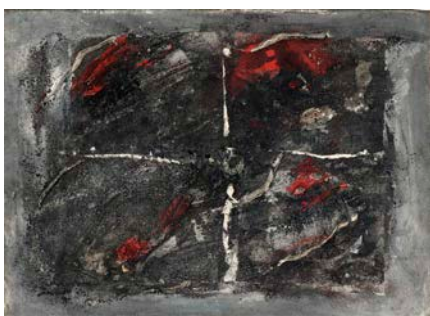
図版 9. 《構成 白い十字》1947年 油彩、カンヴァス 32.5 × 45 cm 国立国際美術館

1940年に釈放されたヴォルスは、南フランスを転々としながら再び精力的に制作します。1942年にはニューヨークのベティーパーソンズギャラリーで水彩画の個展が開かれました。同年、ドイツ軍が南フランスを占領したため、夫妻はデュルフェイに逃れます。この地で夫妻は、マルセル・デュシャンとニューヨーク・ダダを推進したアンリ=ピエール・ロッシェと知り合います。ロッシェはヴォルスのよき理解者となって水彩画をコレクションし、ヴォルスについての文章も書いています。ロッシェらの協力で戦後は展覧会の機会も増えていきました。ヴォルスが本格的に油彩画に着手したのは戦後のことです。画商の勧めでカンヴァスを与えられ、独学で描いたその絵は、激しい筆致、絵の具の盛り上げ、ドリッピング、グラッタージュ（ひっかき）など、多彩な手法を使って動きのある画面となりました。