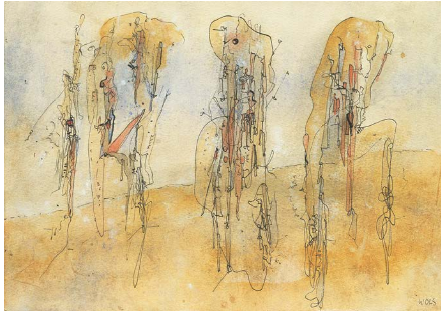
図版1.《無題》1942 / 43年 グアッシュ、インク、紙 14.0×20.0cm DIC川村記念美術館

ヴォルス（1913-1951）は音楽と詩に親しみ、独学で絵を描くようになった稀有な芸術家です。ドイツに生まれ、1930年代にパリで写真家として成功するも、ドイツとフランスの戦争が始まると敵国人として収容所などを転々とし、不遇な環境下で描画の才能を伸ばし、第二次大戦後はサルトルら文学者に認められ、死後は「アンフォルメル先駆者」と評されました。本展は写真・水彩・油彩・銅版画そして言葉と、メディアを横断したヴォルスの作品世界全体を約120作品でご紹介する日本で初めての機会です。