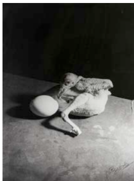
図版 3. 《無題》1939 / 79年 ゼラチンシルバープリント 30.7 x 22.9 cm 横浜美術館

カメラの前でおどけて連続ポーズをとる自写像、路上生活者たちに寄せる視線も見どころです。ヴォルスのヴィンテージプリントはほとんど残っておらず、本展ではゲッティ美術館と東京都写真美術館が所蔵する貴重な4点を展示します。主には、作家の死後に夫人が整理したネガから、1970年代に作成されたモダンプリントを展示します（ゲッティ美術館、横浜美術館、東京都写真美術館より借用）。