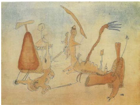
図版 7. 《人物と空想の動物たち》1938-40年 グアッシュ、インク、紙 22.5×31.0 cm ギャラリーセラー

ヴォルスは少年時代にパウル・クレーの展覧会を見たと言われています。浮遊する形体や線描と色彩の層をなす関係のなかにその影響を指摘できるかもしれません。何かをスケッチするのではなく、目を閉じて待ち、現れてくるヴィジョンを描いたとも言われます。初期の特徴は澄んだ色彩とのびやかな幻視力です。中空に浮かぶ街や浮遊する船のイメージを線描で描きながら、写真制作を中断した 1942 年頃から彼の線は特定のかたちからほぐれるように抽象化に向かっていきます。