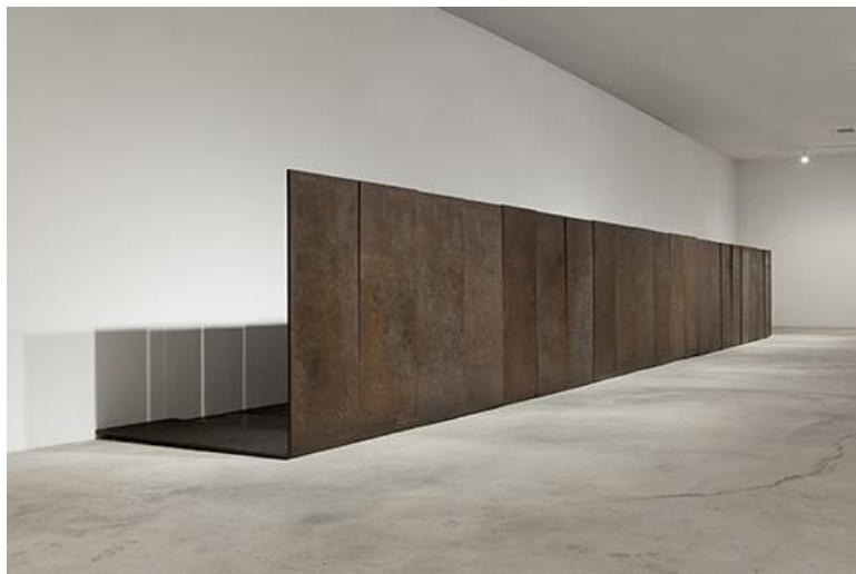
貸出図版5. カール・アンドレ《上昇》2011年 熱延鋼の直角板21枚 (各) 185.4×185.4×71.1 cm (全体) 185.4 × 185.4 × 1493.1 cm Estate of the Artist © 2023 Carl Andre / Artists Rights Society (ARS), New York. Courtesy Paula Cooper Gallery, New York.