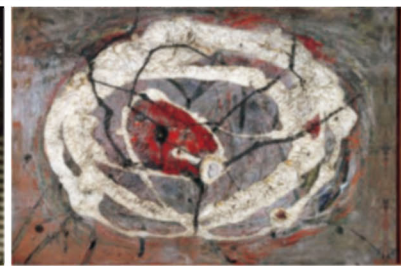
(上) 《人物と空想の動物たち》1936-40年 グラッシュ、インク、紙 22.5×31.0cm ギャラリーセラー (左下) 《ニコール・ボウバン》c. 1933/76年 ゼラチンシルバープリント 13.6×20.2cm The J. Paul Getty Museum, Los Angeles (右下) 《開路》1948/49年 油彩、カンヴァス 32.0×46.0 cm DIC川村記念美術館