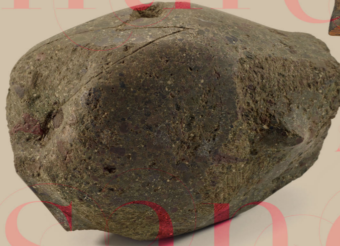
fig. 03 The Life, Anger and DIC川村記念美術館 Kawamura Memorial DIC Museum of Art 千葉県佐倉市坂戸631 電話 0120-498-130 http://kawamura-museum.dic.co.jp