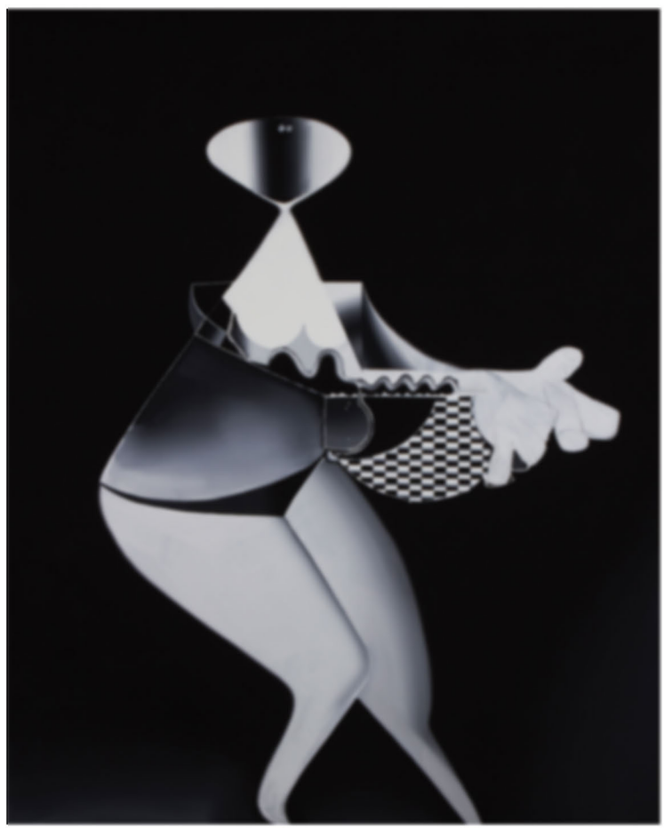
Showgirl, 2013 Collection of Kaws, New York