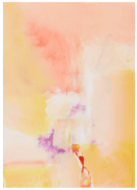
CAIRO (works on paper), 2013

●五木田智央デザインの本展オリジナルグッズをミュージアムショップで展開します！Tシャツ、エコバッグ、缶バッジ、スタンプ、ビールグラスなど