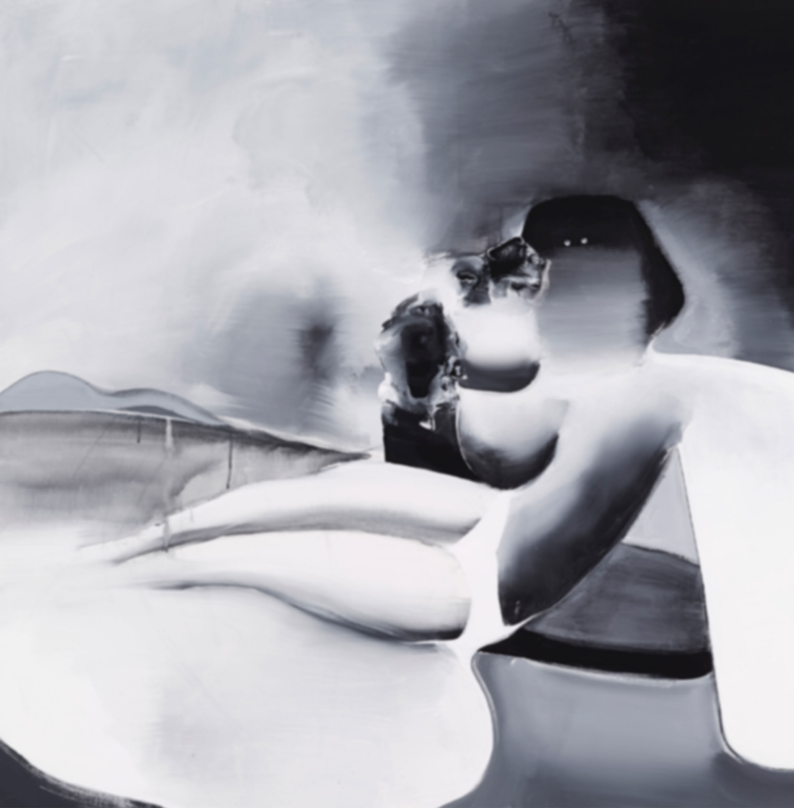
At the Weekend, Dark Clouds Hang Low, 2014