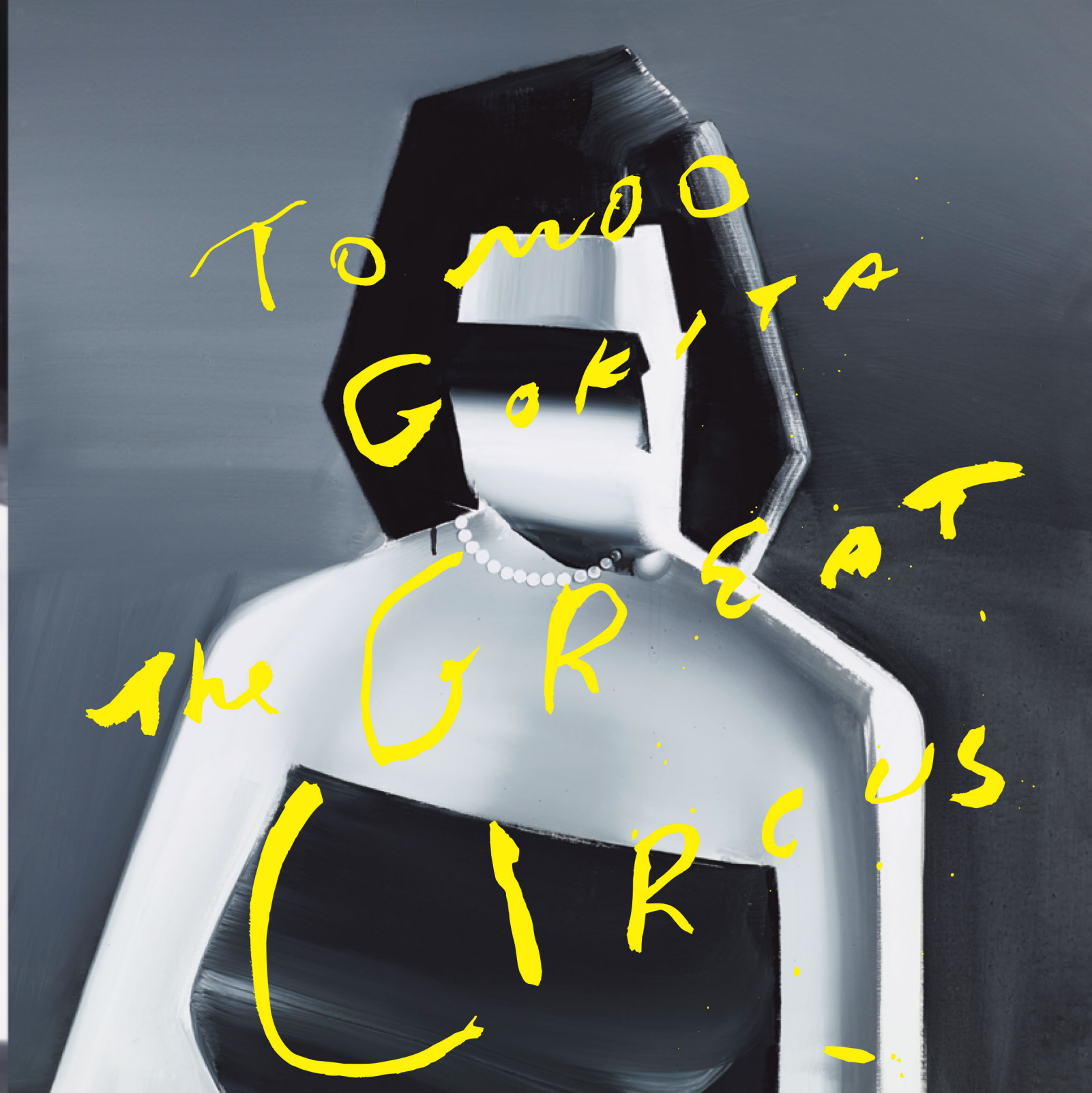
New Sad, 2014