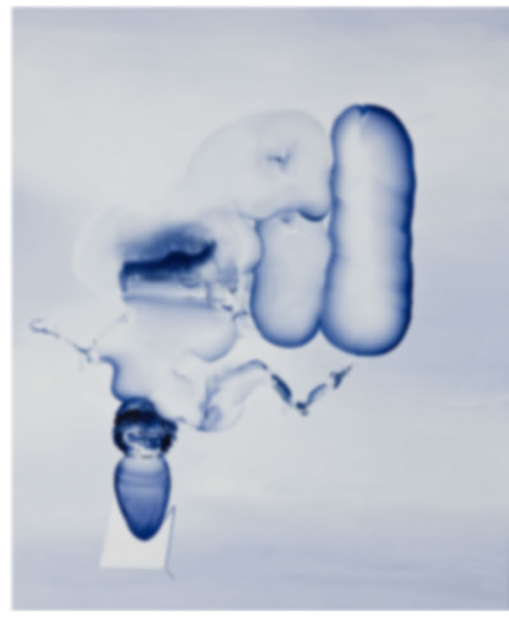
This Misunderstanding, 2009

●両館を結ぶ無料送迎バスを運行します（土・日・祝日限定） 所要時間約40分、定員37名 11/1(土)、2(日)、3(月・祝)、8(土)、9(日)、15(土)、16(日)、22(土)、23(日)、24(月・祝)、29(土)、30(日)、 12/6(土)、7(日)、13(土)、14(日)、20(土)、21(日)、23(火・祝)、 千葉市美術館 発 → DIC川村記念美術館 行 12:00/14:00 DIC川村記念美術館 発 → 千葉市美術館 行 13:00/15:00