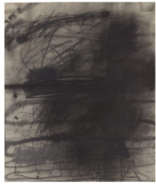
Untitled (works on paper), 2003