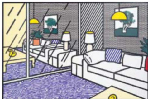
《青い床の室内が描かれた壁紙》 1992年 スクリーンプリント、クリアコート、紙、マイラーシート、合板 © Estate of Roy Lichtenstein, New York & JASPAR, Tokyo, 2013 E0398

DIC川村記念美術館のコレクションから、アメリカ、ポップアートを代表する画家ロイ・リキテンスタイン(1923―1997)の版画作品を展示いたします。1960年代より、漫画をモチーフに、鮮やかな色彩と簡潔な輪郭線、印刷のドットを強調して描いた作品により広く知られていますが、モノの作品を再解釈した《積み藁》や《大聖堂》のシリーズ、建築装飾を絵画化した《エンタプラチア》など、視覚芸術の本質を問い直すその業績の一端を紹介いたします。