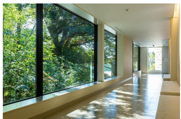
木漏れ日が差す廊下