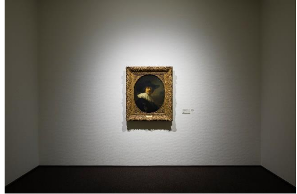
102室 レンブラント・ファン・レイン