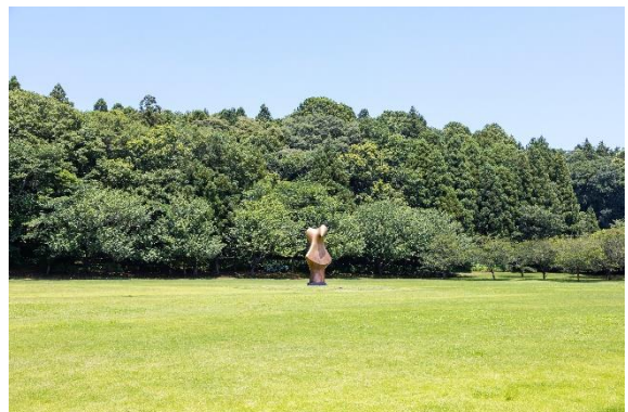
ムーア彫刻と広場