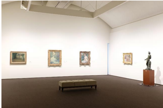
101室 印象派からエコール・ド・パリへ