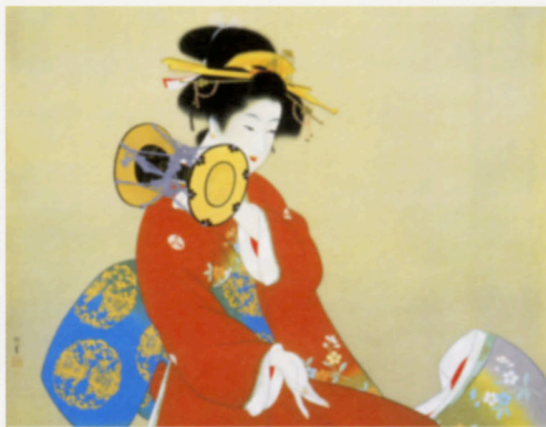
左|《鼓の音》1940(昭和15)年 右|《雪》1940(昭和15)年頃