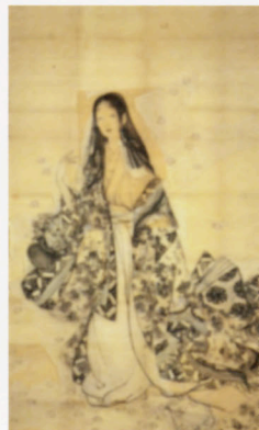
左|《人形つかい》1910(明治43)年 中|《序の舞》下絵1936(昭和11)年 右|《花がたみ》下絵1915(大正4)年