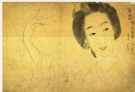
左|《鼓の音》下絵1940(昭和15)年 中|《草紙洗小町》下絵1937(昭和12)年 右|《富勇1》制作年不詳