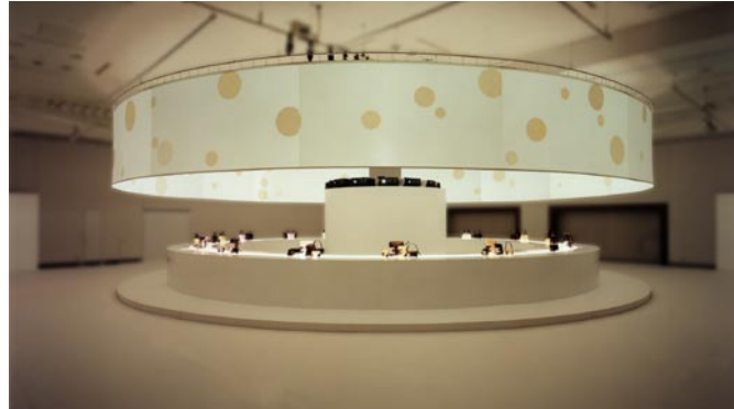
CHANEL 「Cambon Line」 Collection プレスプレゼンテーション ステージデザイン