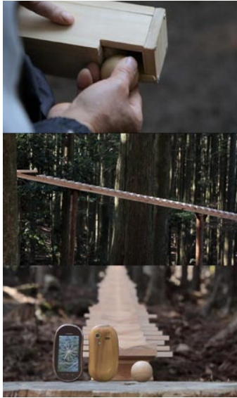
NTT DOCOMO 「森の木琴」 スペシャルwebサイトAD