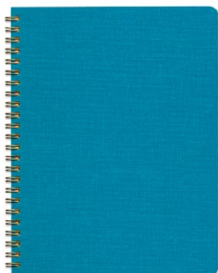
FOLK notebooks STANDARD