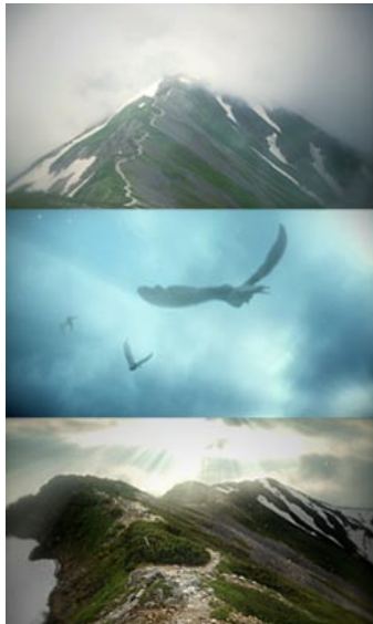
NHK スペシャルドラマ「坂上の雲」 オープニングタイトルバック