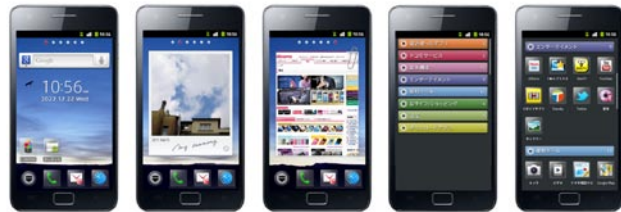
NTT DOCOMO 「Palette_UI」 インターフェースデザイン